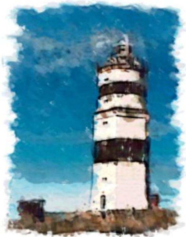
Örskärs fyr

för Östhammars kommuns arbete med anledning av SKB:s platsundersökning vid Forsmark Verksamhetsåret 2008