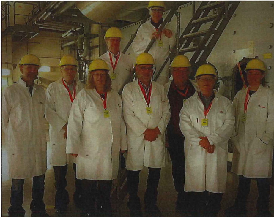
MKB-gruppen på studiebesök i Barsebäck