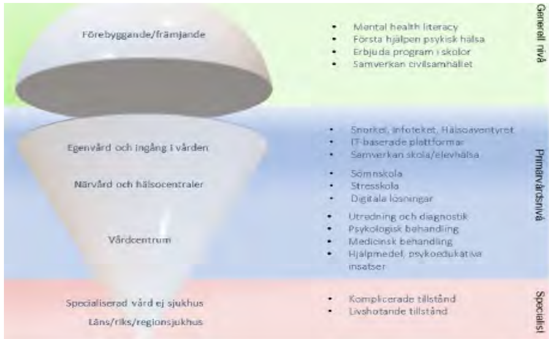
Bild från rapporten "Barn och ungas psykiska hälsa Region Uppsala 2020-2030"

Under hösten startar arbete för att minska väntetider till vård samt start av behovs- och resursanalys tillsammans med kommuner och andra berörda aktörer utifrån lokala förutsättningar. Utskottet för hälso- och sjukvård ställde sig bakom förslagen i augusti 2019.