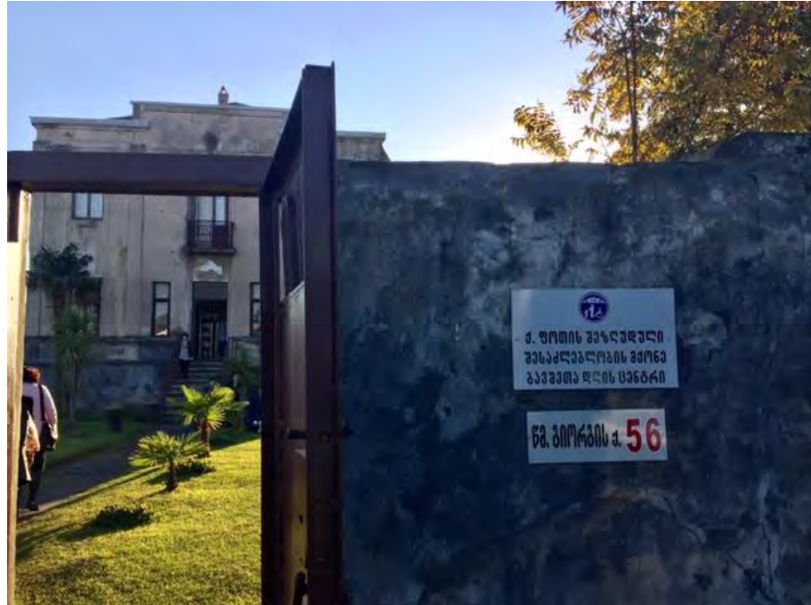
Centrat för funktionshindrade barn i Poti

Personalen som arbetar där har ingen utbildning och är i stort behov av kompetensutveckling.