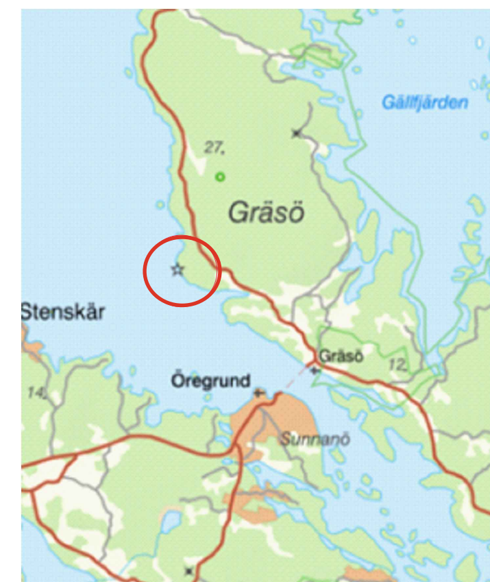
Översiktskarta med planområdet markerat inom röd cirkel.