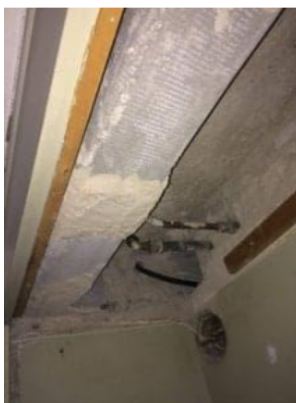
Asbest rör