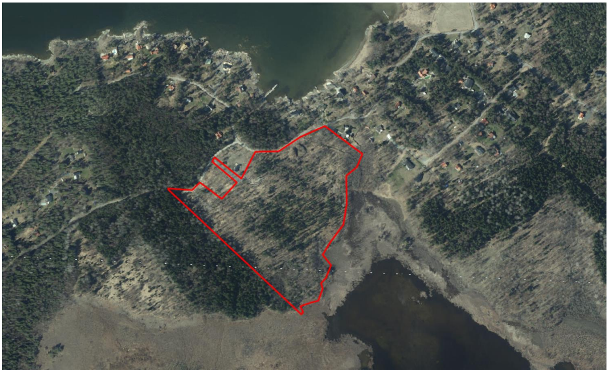
Ortofoto över planområdet

Direkt norr om planområdet finns två avstyckade tomter för villor/fritidshus. Till Öregrund, som är den närmsta tätorten med service så som matbutik, är det ca 11 km. Närmsta skola är Snesslingeskolan på ca 9,5 km avstånd som är en lågstadieskola med en förskoleklass. Till den större landsvägen, väg 1100, där det finns kollektivtrafik till Öregrund och Uppsala är det ca 4,5 km.