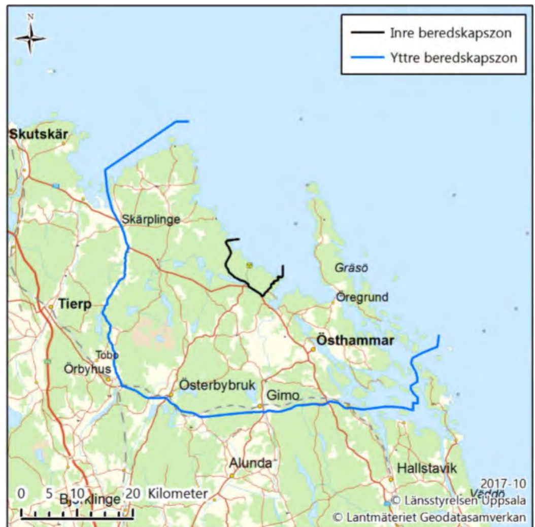
Beredskapszoner. Förslag på inre och yttre beredskapszon kring Forsmarks kärnkraftverk.

Inom beredskapszonerna ska det finnas en planering för utrymning, inomhusvistelse och intag av jodtabletter samt system för varning av allmänheten och förhandsutdelad information om åtgärder vid larm. Inom planeringsavståndet ska det finnas en planering för utrymning som bygger på strålningsmätningar samt planering för inomhusvistelse och begränsad extrautdelning av jodtabletter.