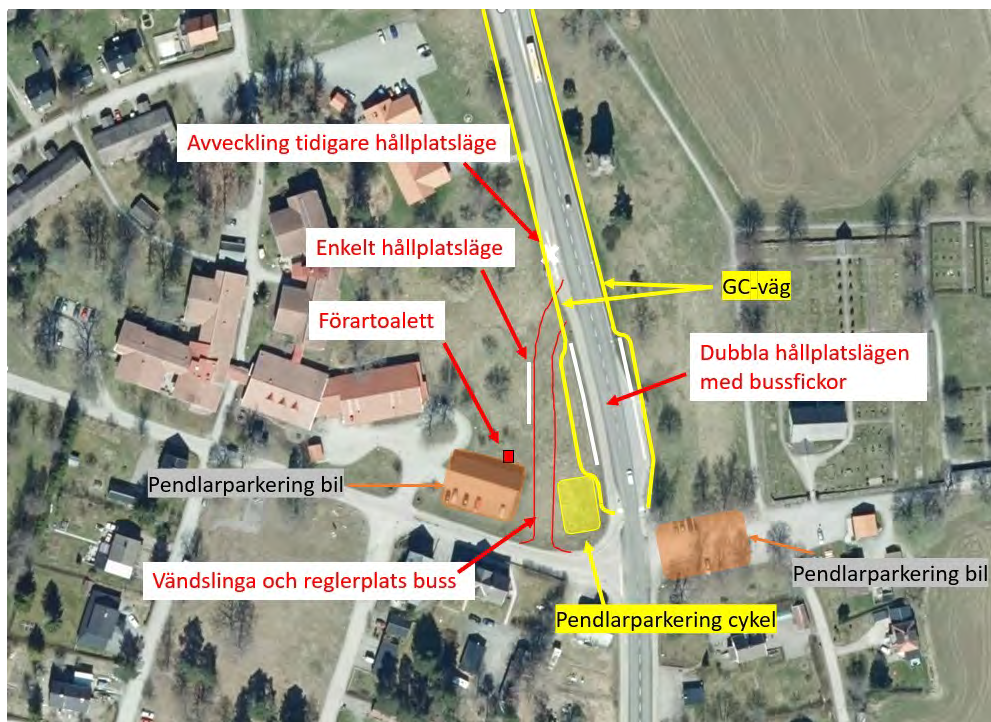
Karta 1: Utformningsskiss Gimo bytespunkt. Denna utformningsskiss kan komma att förändras utifrån det detaljplanarbete som Östhammars kommun påbörjat.